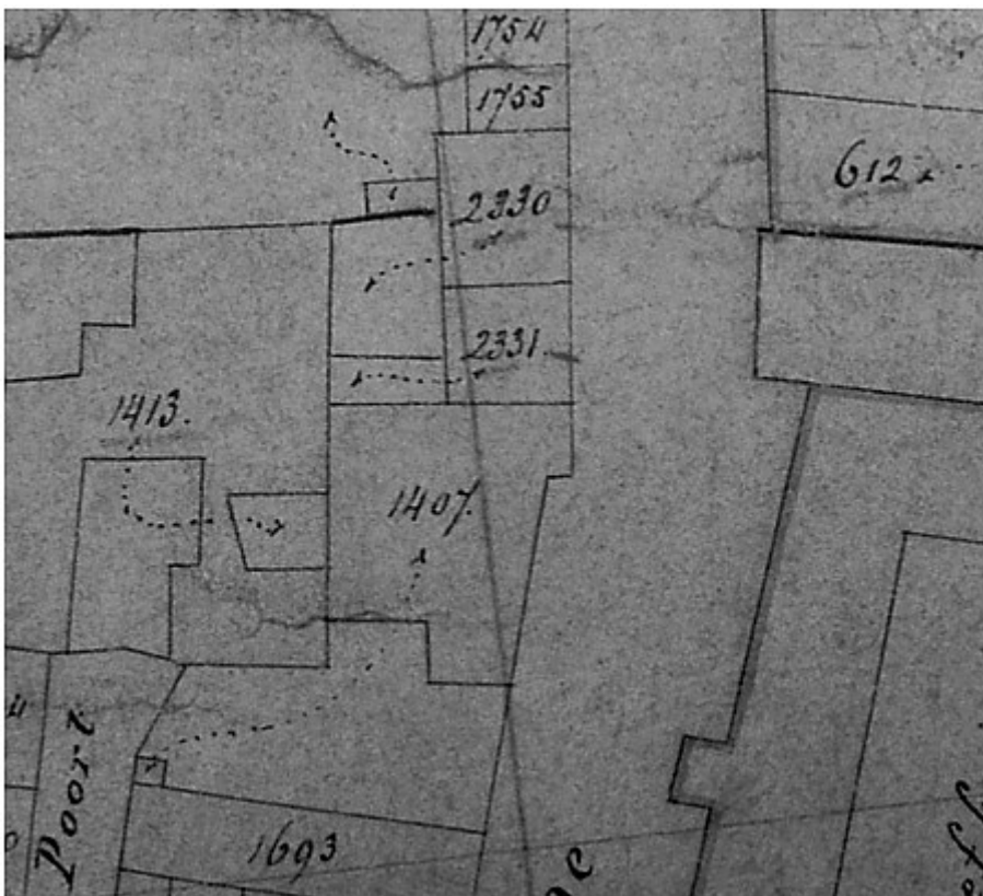
Kadastrale kaart 1860

In dienstjaar 1872 werden de percelen H1407, H2330 en H2331 eigendom van Maria Theresia van der Sanden (artikelnummer 4247) te 's-Hertogenbosch.