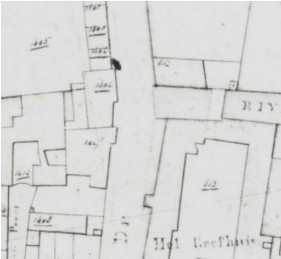
Minuutplan van 1832

Hieronder een opsomming van kadastrale wijzigingen, die ik heb gevonden van het ontstaan van H1406 en H1407 tot vorming van de percelen H5312, H5708 en H5709 en de eigenaren.